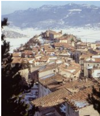
Abruzzo: Pescocostanzo. veduta del centro storico. *Commento di Roberto Boccalatte: 08 febbraio 2010, alle ore 13:07'