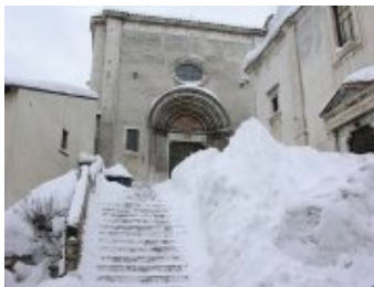
Abruzzo: Pescocostanzo, a oltre 1400 di altitudine l'inverno è rigido. *Commento di Roberto Boccalatte: 08 febbraio 2010, alle ore 13:25'