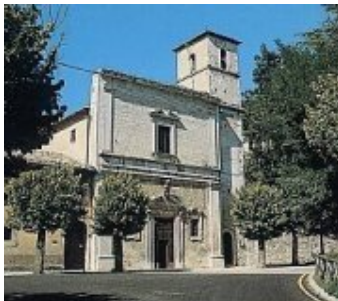
Abruzzo: Pescocostanzo Il Convento dei Cappuccini.

*Commento di Roberto Boccalatte: 08 febbraio 2010, alle ore 13:04'