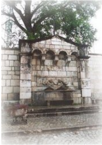
Abruzzo: Pescostanzo, la fontana.

*Commento di Roberto Boccalatte: 08 febbraio 2010, alle ore 13:08'