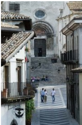
Abruzzo: Pescocostanzo. Veduta esterna della Collegiata S. Maria del Colle. *Commento di Roberto Boccalatte: 08 febbraio 2010, alle ore 13:24'