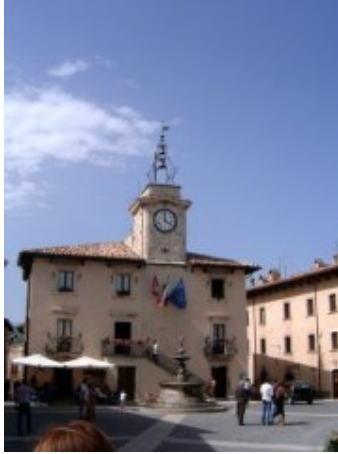
Abruzzo: Pescocostanzo, palazzo del Municipio.

*Commento di Roberto Boccalatte: 08 febbraio 2010, alle ore 13:02'