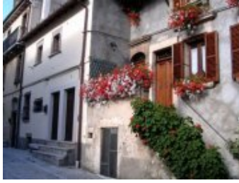
Abruzzo: Pescocostanzo Le tipiche case pescolane. *Commento di Roberto Boccalatte: 08 febbraio 2010, alle ore 13:05'