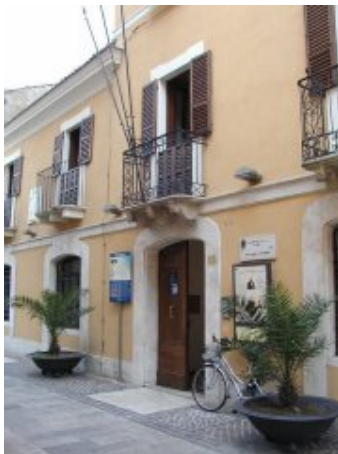
Pescara - Casa di Gabriele D'Annunzio

La Provincia di Pescara è caratterizzata dalle varietà paesaggistiche che vanno dal litorale sabbioso agli spettacolari canyons appenninici. La città di Pescara è nata nel 1926 dalla fusione della più antica città di Pescara che a partire dall' XI° secolo era denominata Piscaria. Pescara rappresentò un porto importante nel periodo romano.