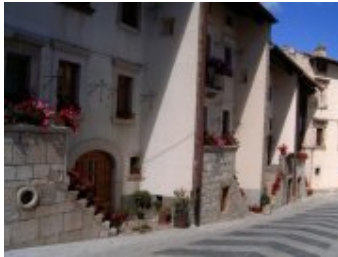
Abruzzo: Pescocostanzo, le cosiddette "Case a schiera" con i muri frangivento.

*Commento di Roberto Boccalatte: 08 febbraio 2010, alle ore 13:03'