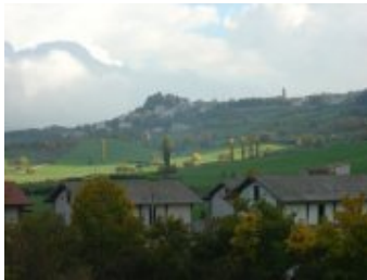
Abruzzo: Pescocostanzo veduta del paese

*Commento di Roberto Boccalatte: 08 febbraio 2010, alle ore 13:02'