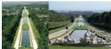
Caserta - Reggia di Caserta

A nord si presenta il massiccio montuoso degli Appennini formato dal Matese, al centro monti di modesta altura e colline, e al sud e ad ovest da pianure di diversa tipologia.