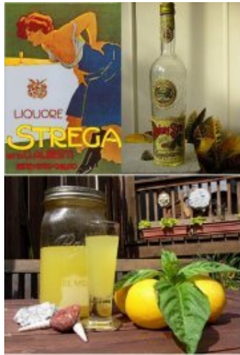
Il liquore di Benevento "La Strega" ed il limoncello di Sorrento