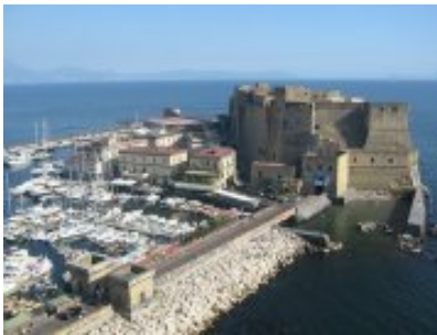
Napoli - Castel dell'Ovo

È uno dei più antichi della città di Napoli ed è uno degli elementi che spicca maggiormente nel celebre panorama del Golfo. Il suo nome deriva da un'antica leggenda secondo la quale il poeta latino Virgilio - che nel medioevo era considerato anche un mago - nascose nelle segrete dell'edificio un uovo che mantenesse in piedi l'intera fortezza. La sua rottura avrebbe provocato non solo il crollo del castello, ma anche una serie di rovinose catastrofi alla città di Napoli.