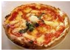
Pizza Margherita http://it.wikipedia.org/wiki/Pizza

L'isola di Capri è situata nel Golfo di Napoli, tra la penisola sorrentina, Capo Miseno e le isole di Procida e Ischia.