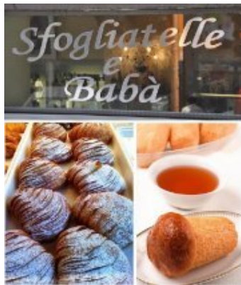
Le sfogliatelle ed il babà