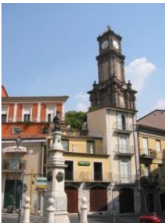
Avellino - Torre dell'orologio

L'economia si è più fortemente sviluppata dopo il sisma del 1980 quando sono state realizzate molte infrastrutture. Nel settore agricolo la coltura di tabacco, uva e soprattutto nocciole, grazie anche agli investimenti degli ultimi anni, impiegano una grande forza lavoro, in particolar modo nelle zone ai piedi del Partenio.