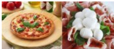
La pizza e la mozzarella di bufala