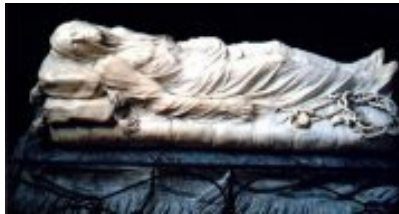
Napoli . Il Cristo Velato

http://it.wikipedia.org/wiki/Galleria_Umberto_I