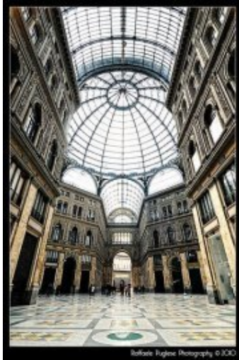
Napoli - Galleria Umberto I

È una galleria commerciale a quattro braccia che si intersecano in una crociera ottagonale coperta da una cupola.