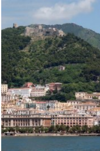
Salerno - Castello di Arechi

È un castello di origine medievale, situato ad un'altezza di circa 300 metri sul livello del mare, sorge sulle ceneri di un castrum romano e domina tutta la città di Salerno.