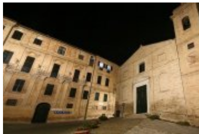
Macerata - Palazzo Leopardi

Nella foto di sopra un panorama della città, sullo sfondo si vedono i monti Sibillini.